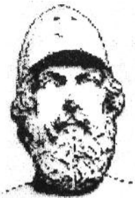
ΘΕΜΙΣΤΟΚΛΗΣ ΝΕΟΚΛΕΟΥΣ, ΦΡΕΑΡΡΙΟΣ (525 - 460; π.χ.)