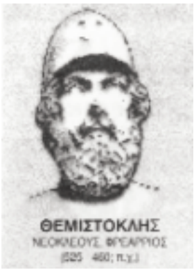
ΘΕΜΙΣΤΟΚΛΗΣ ΝΕΟΚΛΕΟΥΣ ΘΕΡΑΠΠΟΣ (525 - 460 π.χ.)