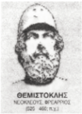
ΘΕΜΙΣΤΟΚΛΗΣ ΝΕΟΚΛΕΟΥΣ, ΘΕΡΑΠΠΟΣ (525 - 460; π.χ.)