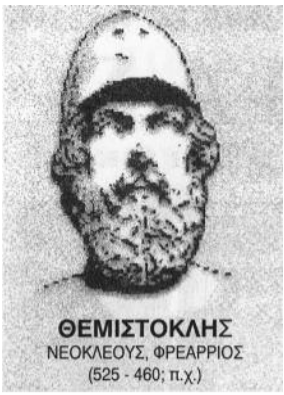
ΘΕΜΙΣΤΟΚΛΗΣ ΝΕΟΚΛΕΟΥΣ, ΦΡΕΑΡΡΙΟΣ (525 - 480; π.χ.)