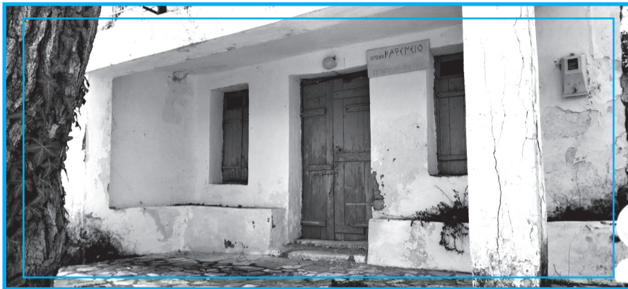
Κλειστό καφενείο στην ορεινή Πελοπόννησο

Στα καφενεία συνήθως γινόταν τα μεγάλα γεγονότα των χωριών με τις κοινωνικές εκδηλώσεις για χαρές και λύπες. Αλλά και πολλά αυτοσχέδια γλέντια με χορούς και τραγούδια, ειδικά τις γιορτινές μέ-