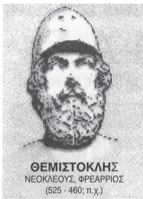
ΘΕΜΙΣΤΟΚΛΗΣ ΝΕΟΚΛΕΟΥΣ, ΦΡΕΑΡΡΙΟΣ (525 - 460; π.χ.)